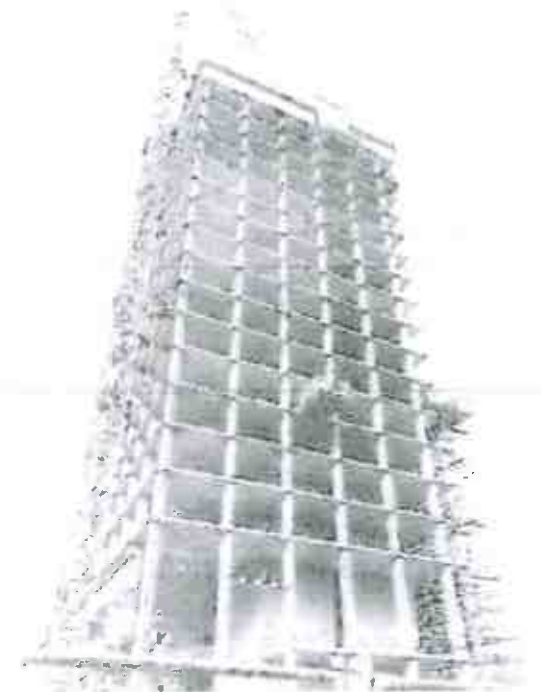
NUOVO PALAZZO UFF. DI REGIONE PIEMONTE