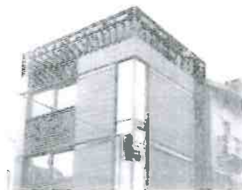
RISTRUTTURAZIONE IN TORINO CORSO FERRUCCI