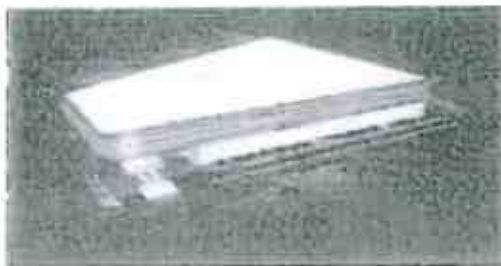
FERRARI - EDIFICIO NUOVA GeS