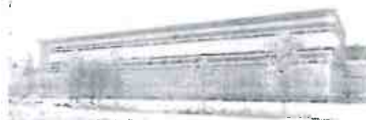
FERRARI - AMPLIAMENTO NUOVA GeS

Progettazione architettonica definitiva ed esecutiva